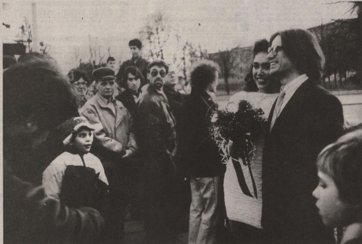
Ost meets West: Hochzeit an der Mauer

Es ist 01.55 Uhr. Ich stehe immer noch frierend an der Haltestelle, im Mund einen ekligsten Rest Nikotingeschmack. Verdammt. Der Nachtbus müsste schon längst hier sein. Ob ich auch mal den Daumen hinaushalten soll? Zehn Minuten später werde ich vor meiner Haustüre abgesetzt. Von einem freundlichen Autofahrer in schwarzer Lederjacke. Na also. Es gibt also doch noch Grund zur Hoffnung.