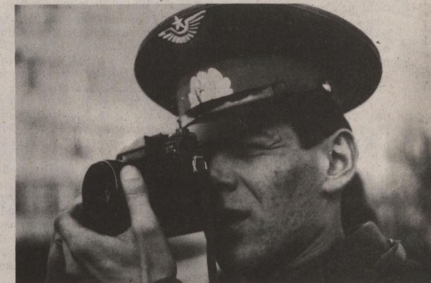
Sowjetischer Soldat: Foto fürs Album